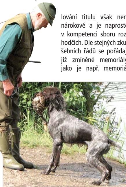
Předání kachny vůdci

lování titulu však není nárokové a je naprosto v kompetenci sboru rozhodčích. Dle stejných zkušebních řádů se pořádají již zmíněné memoriály, jako je např. memoriál