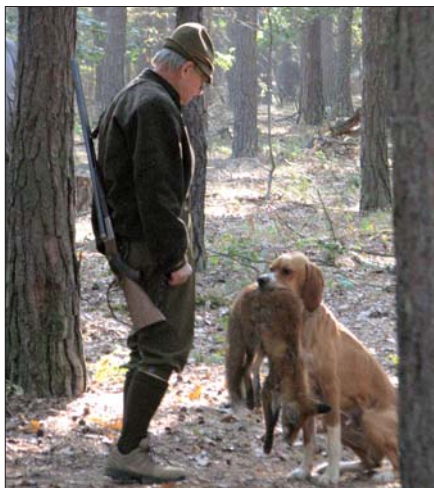
Vzorné odevzdání aport