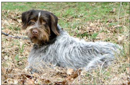
Čekání na disciplínu